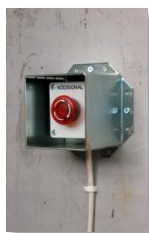
SCG1EE monterad runt SCB3DL